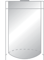
4 Side Sealed